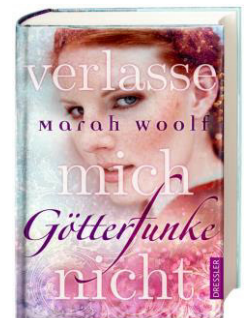
Bd. 3: Frühjahr 2018